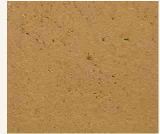
ARCHI+ TADELAKT 011