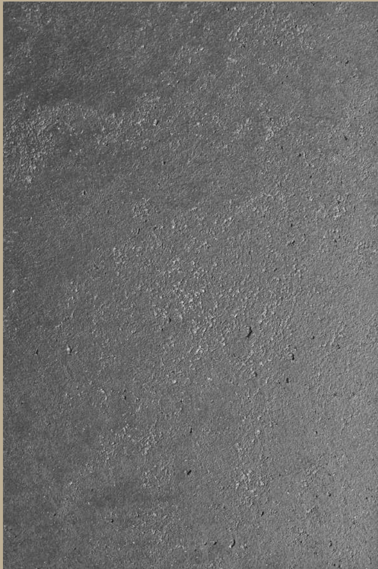
ARCHI+ TADELAKT 001

“ Superfici lisce e sinuose simili al marmo con una componente naturale e materica che dona un estremo piacere al tatto. ”