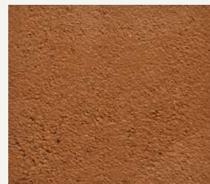
ARCHI+ TADELAKT 013

“ Smooth decorated walls that look like marble, with a natural and mineral visual, and a touch-feel appeal. ”