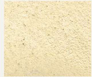
ARCHI+ TADELAKT 010