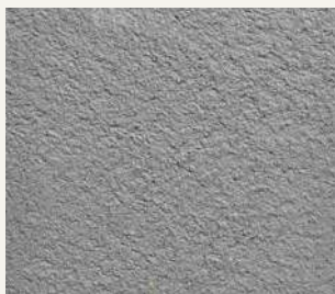
ARCHI+ TADELAKT 005