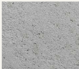
ARCHI+ TADELAKT 008