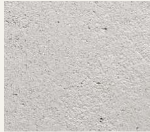
ARCHI+ TADELAKT 007