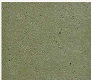
ARCHI+ TADELAKT 004

Le tonalità qui riprodotte, pur avvicinandosi a quelle di fornitura, sono indicative. Per una corretta lettura dei colori si raccomanda di consultare questa cartella alla luce solare. Colours and patterns illustrated are for guidance only. The exact pattern, colours and shades may vary from those shown.