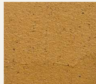
ARCHI+ TADELAKT 012