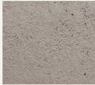
ARCHI+ TADELAKT 006