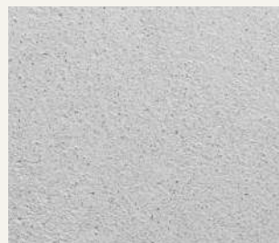
ARCHI+ TADELAKT 009