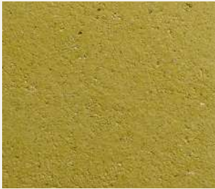
ARCHI+ TADELAKT 003