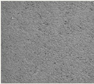
ARCHI+ TADELAKT 002